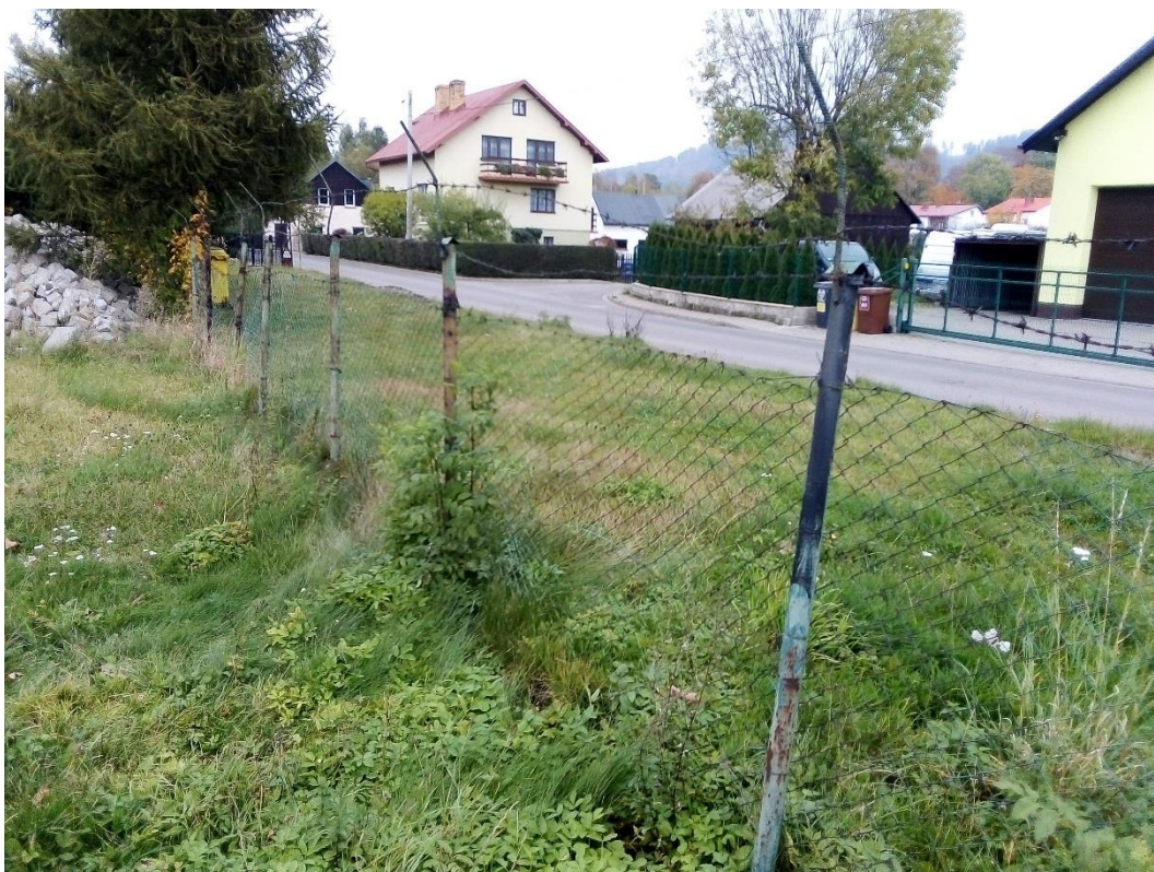
Rys. 1 – stare ogrodzenie zakładu