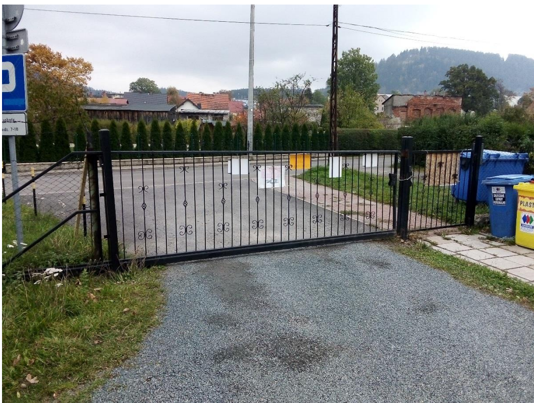
Rys. 2 – stara brama wjazdowa i furтка