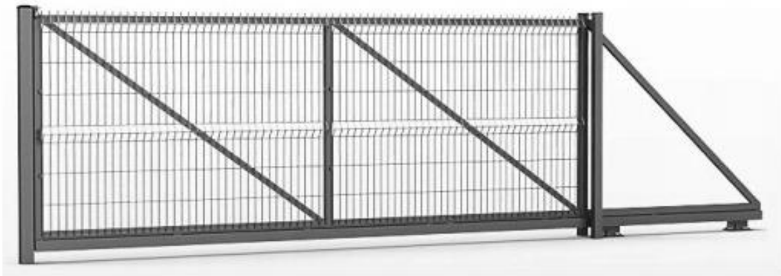
Rys. 3 – koncepcja nowej bramy – rys. poglądowy